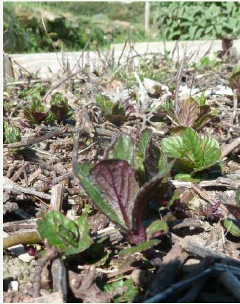
Mizuna Brassica rapa japonica