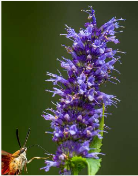
Ail d'Afrique du Sud Tulbaghia violacea