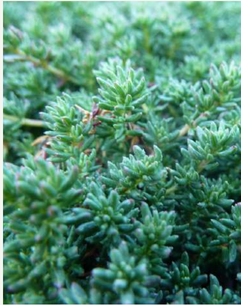
Bugrane rampante Ononis repens