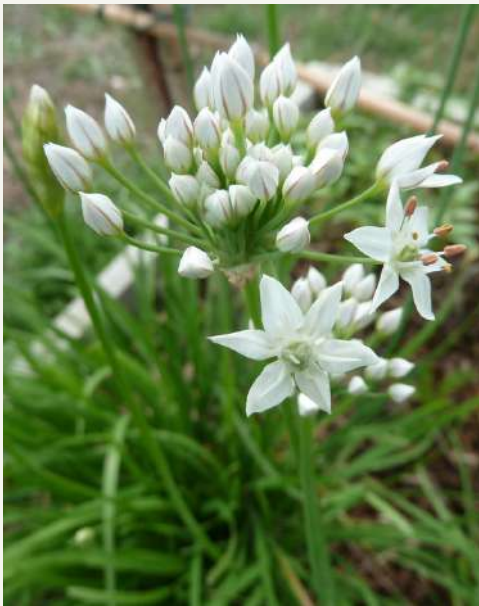
Ail de Naples Allium neapolitanum