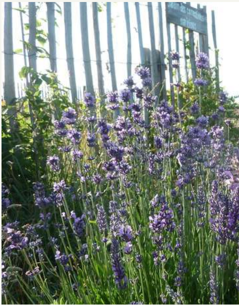
Livèche Levisticum officinale