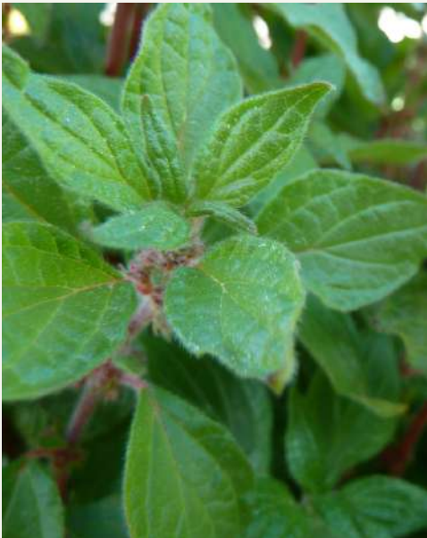
Patate douce Ipomoea batatas